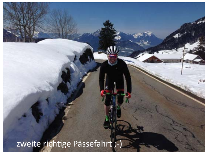
zweite richtige Pässefahrt ;-)