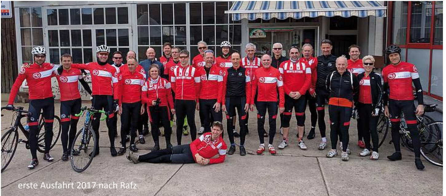
erste Ausfahrt 2017 nach Rafz