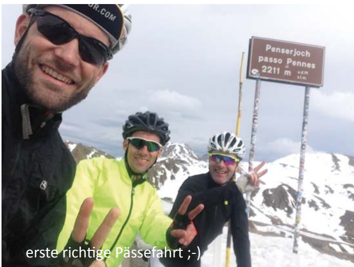
erste richtige Pässefahrt ;-)