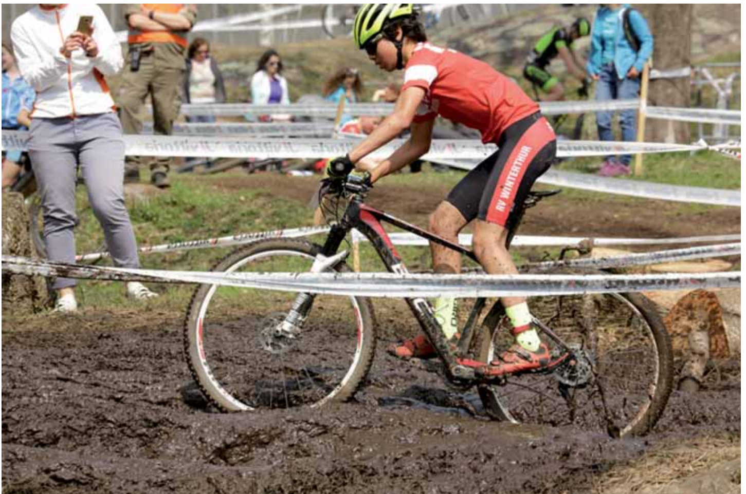
Trotz gutem und trockenem Wetter: etwas Dreck gehört halt schon dazu...