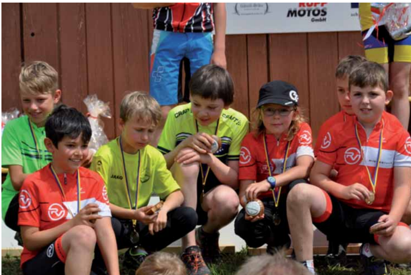
Stolze RVW'ler nach getaner Arbeit