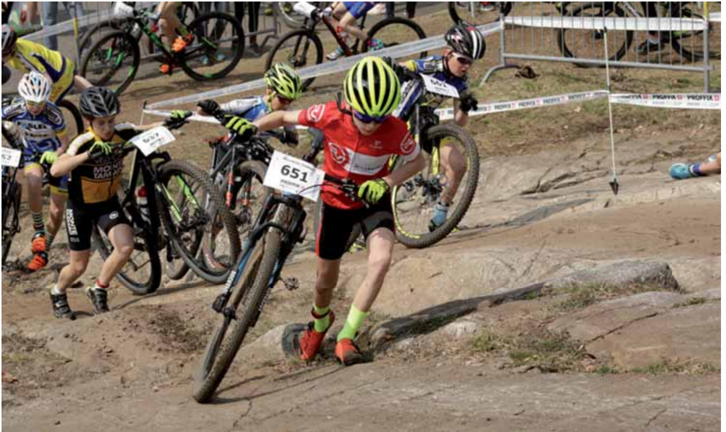
Wer hier in Stau gerät, muss das Bike wohl oder übel den Fels hinaufschieben...