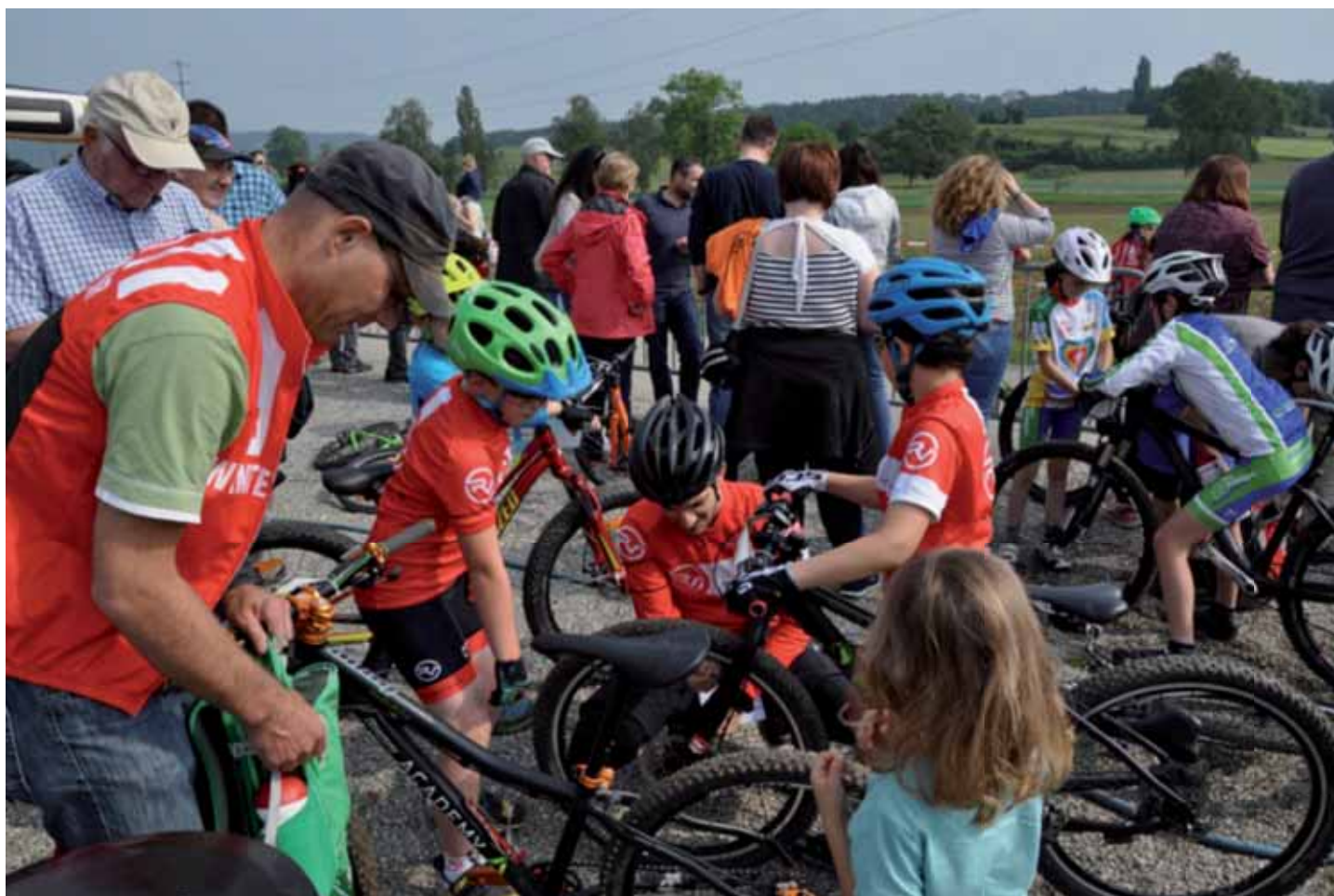
Vorbereitungen vor dem Rennen