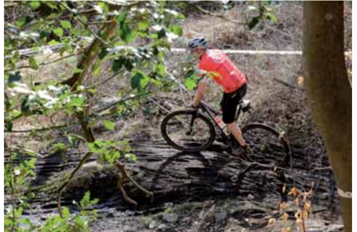
Die Strecke mitten in einer imposanten Naturkulisse aus Fels, Sand, lichtem Wald und Sümpfen

Jetzt war alles vertraut und ich konnte jede Stelle meistern ohne grosse Überwindung.